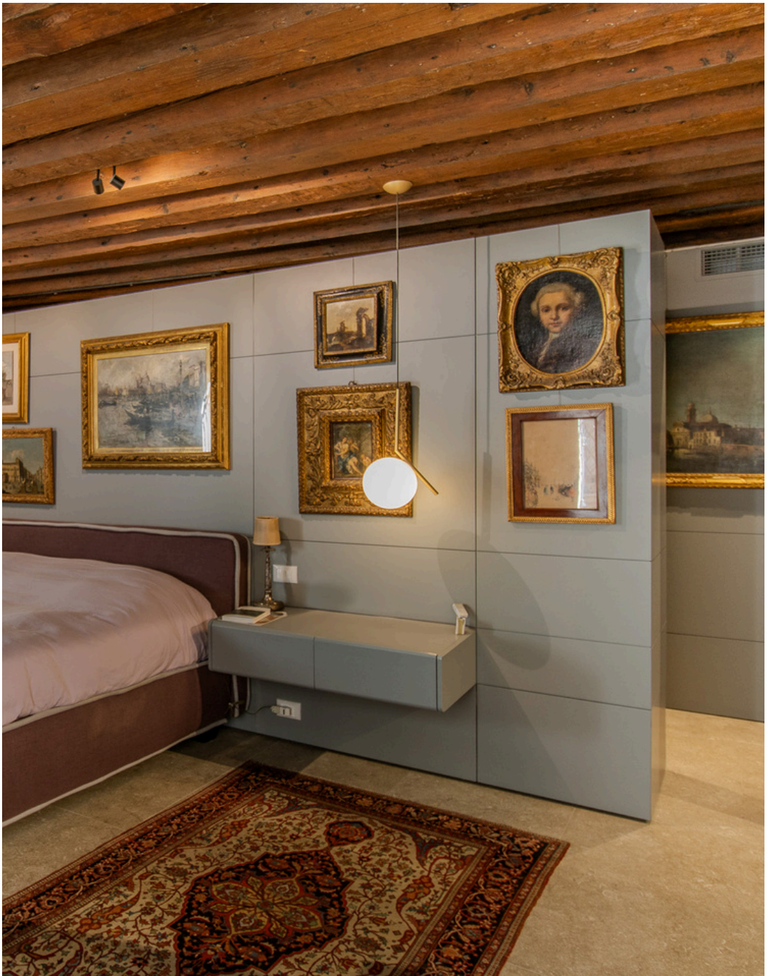
C A B I N A A R M A D I O