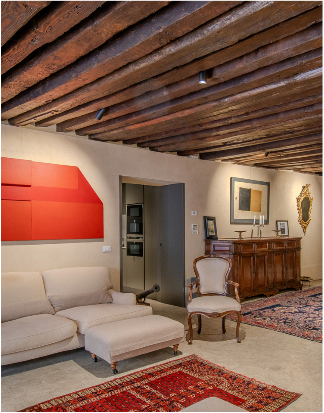
S A L A D A P R A N Z O