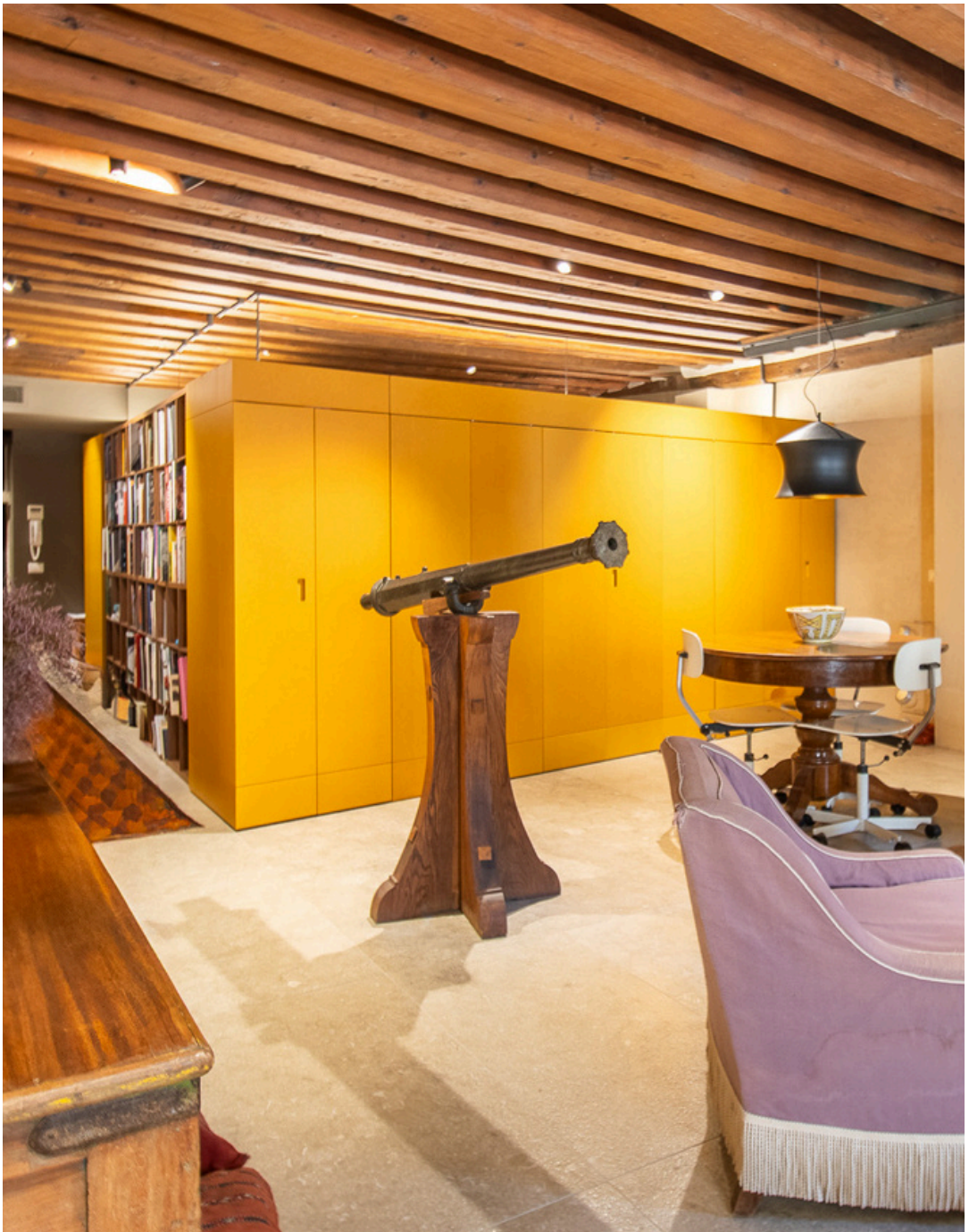
S A L A D A P R A N Z O